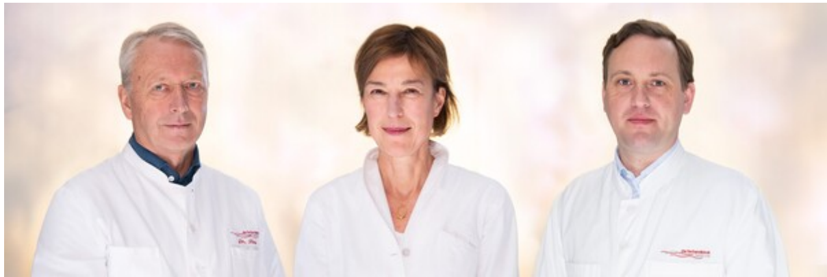
Das engagierte Team der urologischen Praxis